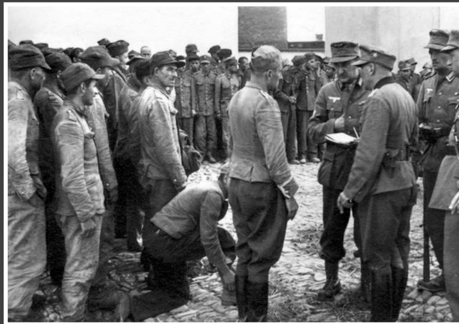
קצינים גרמנים חוקרים שבויים פולנים, ספטמבר 1939.