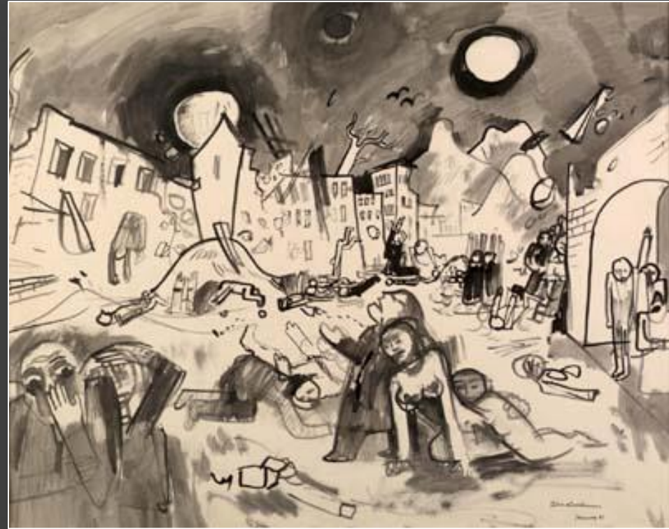
'האסון הגדול', דיו ומגוון על נייר, פליקס נוסבאום, 1939.