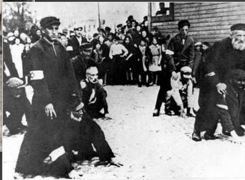
יהודים מושפלים ברחובות העיר, פולין