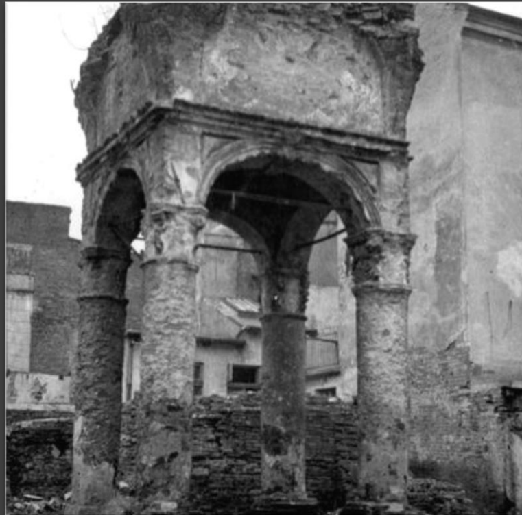
הריסות בית כנסת בלובלין

"בית הכנסת הגדול והמפואר בכיפתו העגולה ובחלונותיו הגבוהים והצבעוניים אחוז להבות היה. מסביב עמדו כבאים ושוטרים. החיילים הגרמניים, שגם הם נכחו שם, רק מילאו פיהם צחוק." מבעד לעיננו – ילדים חווים את השואה, שרה זיסקינד, בת 12, פולין