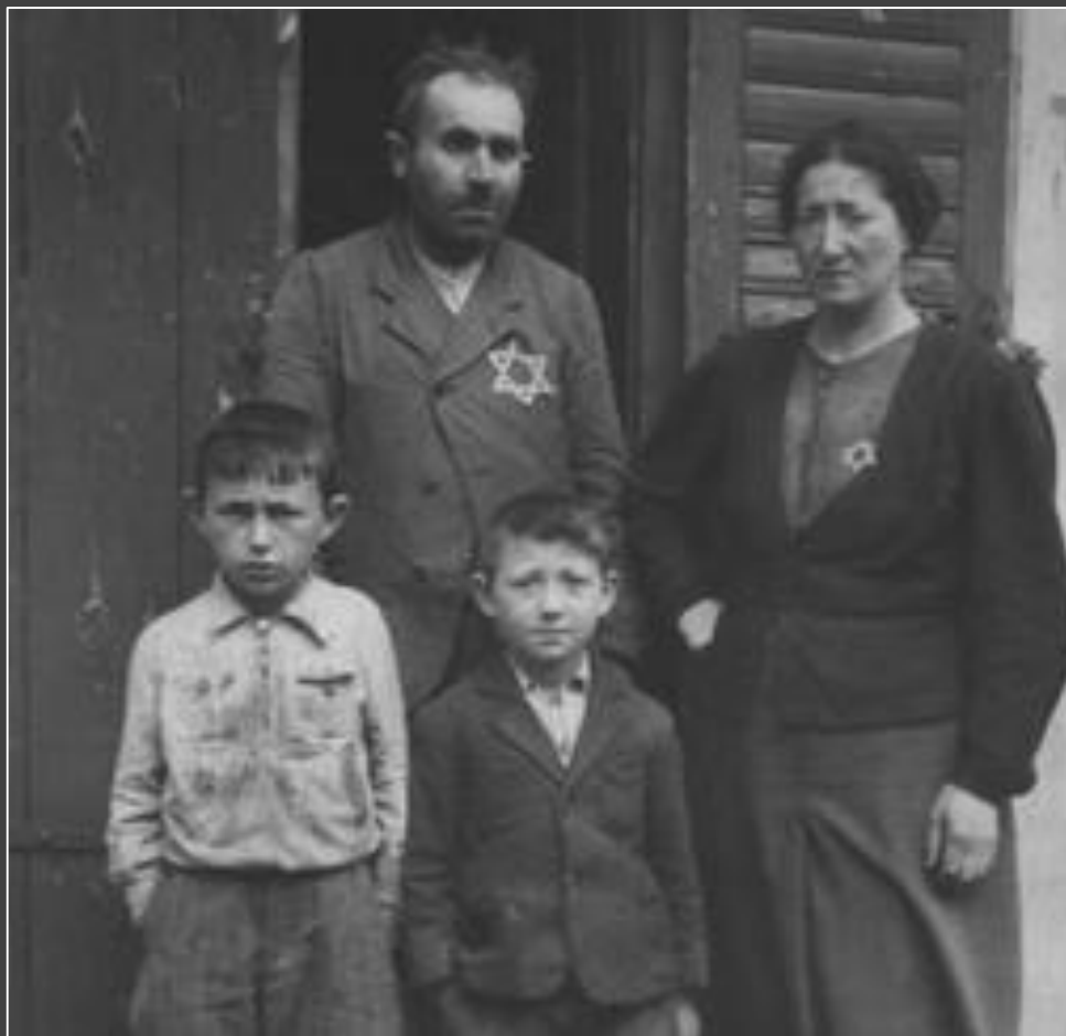
יהודים עונדים טלאי צהוב, וולוצק, פולין