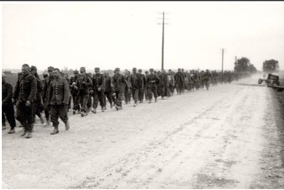
שבויים פולנים מובלים לגרמניה, ספטמבר 1939.

ב- 28 בספטמבר נכנעה ורשה. 16,000 אזרחים ושבויו מלחמה פולנים ויהודים נרצחו על ידי המטרה הבסיסית של מדיניות הנאצים כלפי הפולנים הייתה הרס החברה הפולנית כאומה. לכן, מיד עם הכיבוש פירקו הגרמנים את המוסדות הממלכתיים המרכזיים של פולין, המינהל הפולני, השלטון העצמי וכל הארגונים הפולניים. כ- 90,000 אזרחים, פולנים ויהודים, גורשו בחודשים האחרונים של 1939 לשטחי הגנרלגוברנמן והיחס לפולנים שהושארו בשטחים המסופחים לרייך היה כאל תת-אדם. נאסר עליהם להימצא בכל מקום שבו נמצאו גרמנים והם נושלו מכל רכושם.