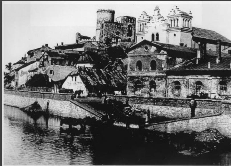
בית הכנסת של העיר בנדין לפני המלחמה. כאמור לעיל, בית הכנסת הוחרב על ידי הגרמנים.