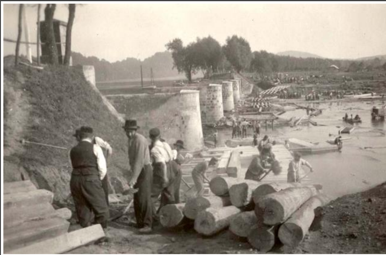
יהודים שאולצו לבנות גשר על הסאן, פשימשל, פולין, אוקטובר 1939

מיד עם כניסת הצבא הגרמני לפולין, החלו גורמים גרמניים שונים לגייס יהודים לעבודות כפייה שונות על ידי חטיפות אנשים ברחוב והוצאתם בכוח מבתיהם. לעיתים המטרה היחידה בעבודות אלו הייתה השפלת היהודים על ידי אילוצם לעבוד בעבודות קשות ללא כל מטרה ממשית, תוך כדי מכות והתעללויות.