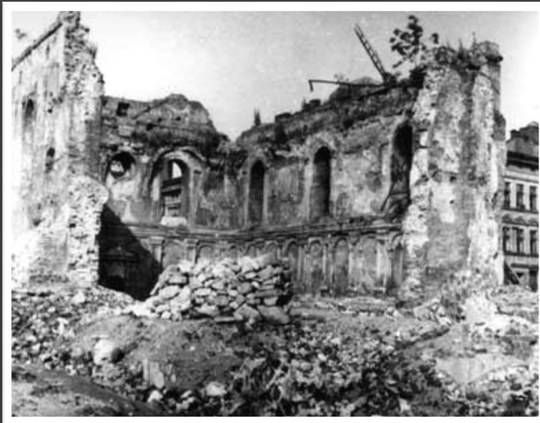
הריסות בית כנסת בפשמישל, פולין

הנאצים, שהיו מודעים לעובדה כי בתי הכנסת שימשו כעמודי התווך של הקהילות היהודיות, ראו אותם כבעלי השפעה הרסנית ומזיקה על התרבות הגרמנית. מבחינתם, סילוק מרכיב חיוני זה של הקהילה היה צעד חשוב לקראת הריסתה.