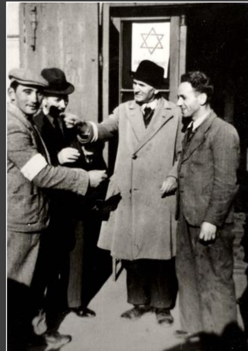
יהודים עם סרט זרוע, ראדום, פולין, 1940.