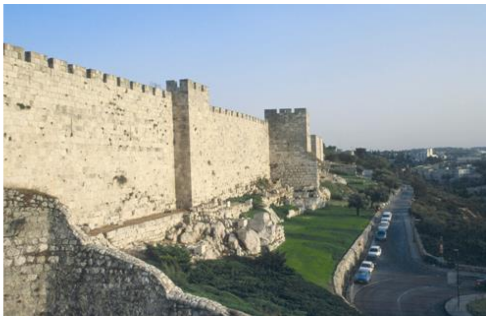
קטע מחומת ירושלים. החלק התחתון של החומה הוא מן התקופה החשמונאית