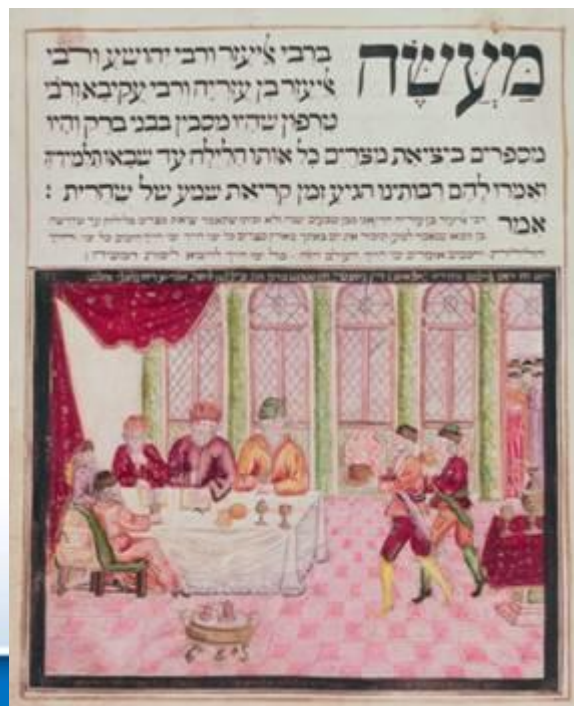
החכמים בבני ברק, הגדה מאוירת ומועתקת בידי יוסף לייפניק, אלטונה, 1740