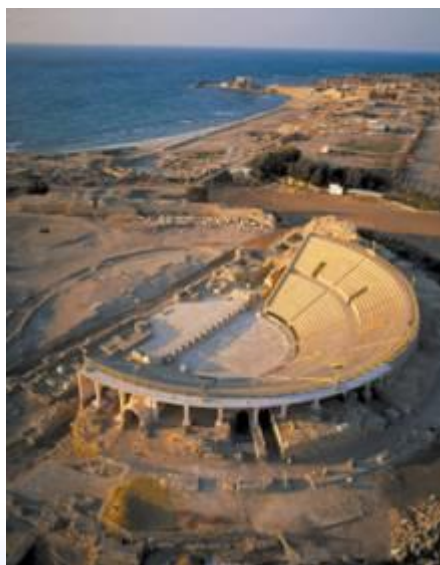
התיאטרון בקיסריה – נבנה על ידי הורדוס בסגנון הרומי

לפרק ו: ממדינה עצמאית למדינת חסות ולפרובינקיה